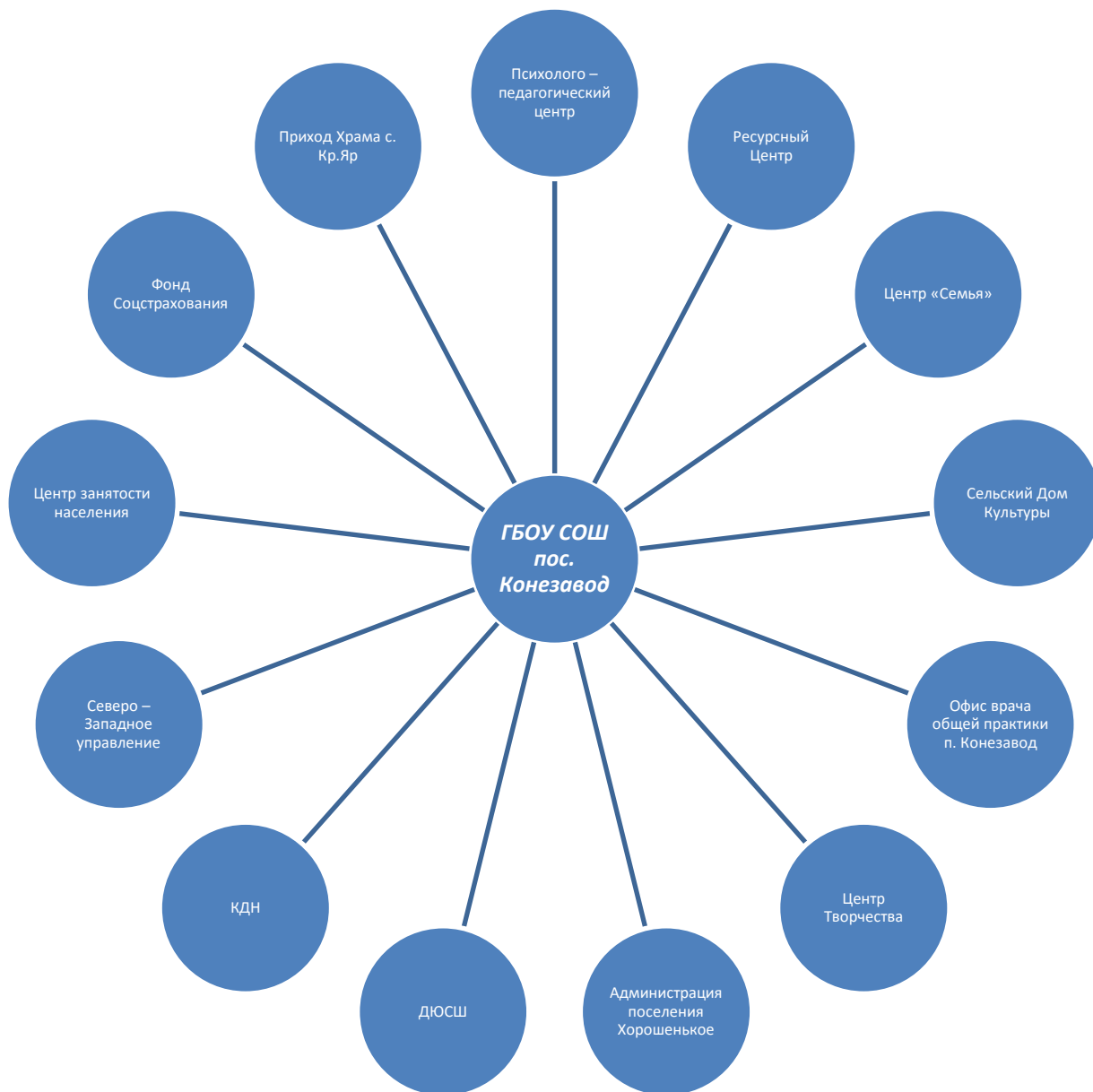
Схема взаимодействия ОУ с учреждениями социокультурной направленности